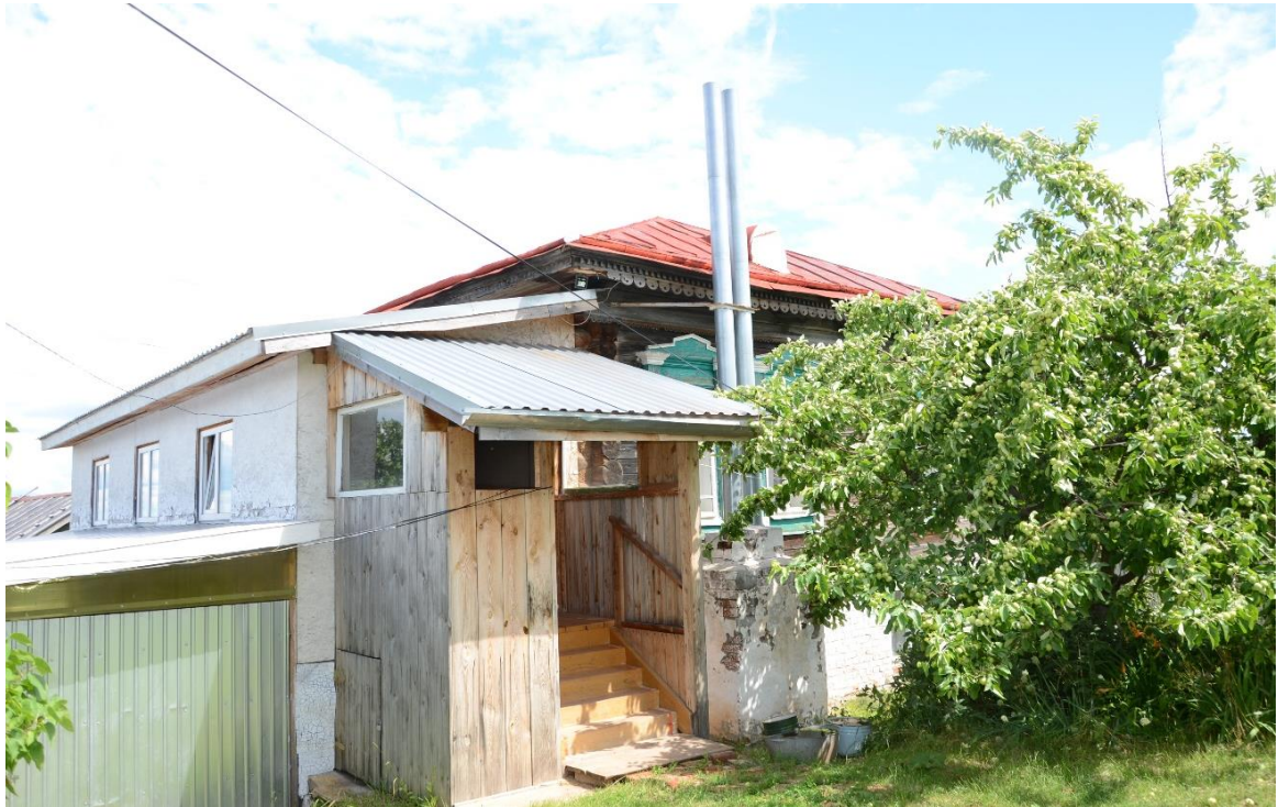
Фото 6. ОКН «Дом Лебедева». Вид на объект с юго-запада.

Без согласования Минкультуры Республики Марий Эл уничтожены западные двухэтажные деревянные сени с обшивкой тесом, имеющие на 2-м этаже два окна с деревянными наличниками и входную дверь главного входа; на их месте выполнено строительство западного двухэтажного пристроя.