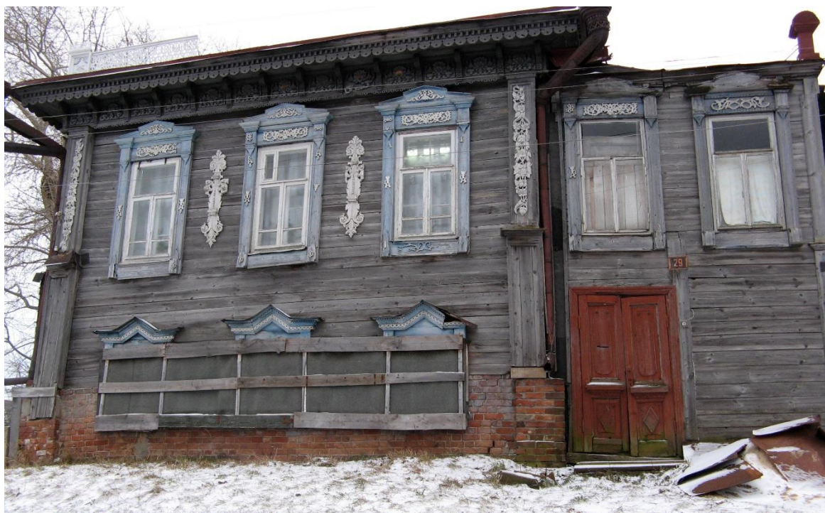
Фото 1. ОКН «Дом Лебедева». Общий вид объекта с улицы Пугачева гора. Фото 21.01.2007.