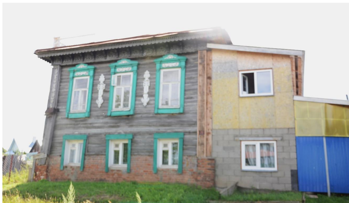
Фото 4. ОКН «Дом Лебедева». Вид на объект с севера.

Отсутствует информационная надпись объекта культурного наследия, без согласования Минкультуры Республики Марий Эл уничтожены деревянные наличники окон 1-го этажа, обрамление декоративной филенчатой западной пилястры северного фасада с барельефной резьбой в верхней части пилястр; уничтожены водосточные трубы, ажурные водосборные воронки с элементами из просечного металла; уничтожены западные двухэтажные деревянные сени с обшивкой тесом, имеющие на 2-м этаже северного фасада два окна с деревянными наличниками и входную дверь главного входа; на их месте выполнено строительство западного двухэтажного пристроя; заполнения оконных проемов 1-го этажа заменены без сохранения рисунка переплетов.