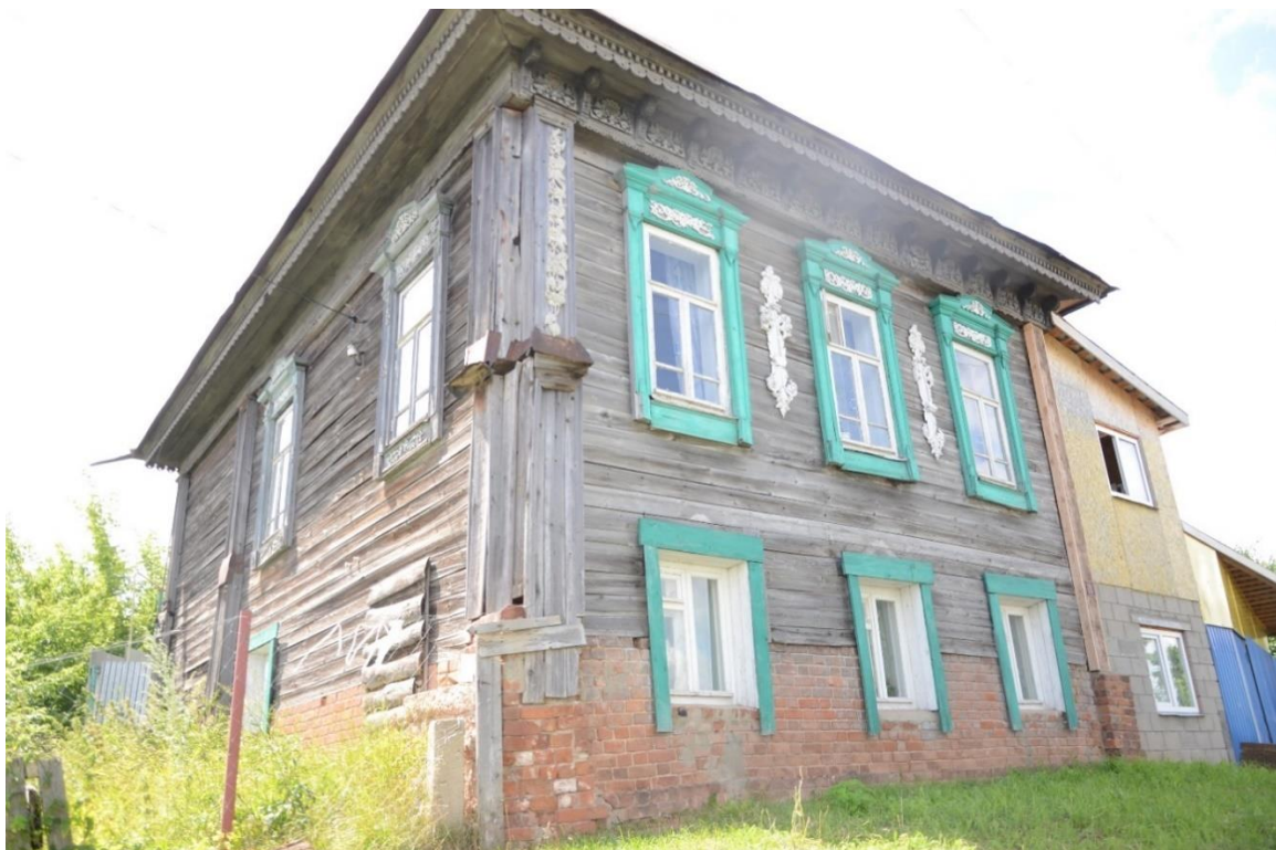
Фото 3. ОКН «Дом Лебедева». Вид на объект с северо-востока.

Отсутствует информационная надпись объекта культурного наследия, без согласования Минкультуры Республики Марий Эл уничтожены деревянные наличники окон 1-го этажа, обрамление декоративной филенчатой западной пилястры северного фасада с барельефной резьбой в верхней части пилястр; уничтожены водосточные трубы, ажурные водосборные воронки с элементами из просечного металла; уничтожены западные двухэтажные деревянные сени с обшивкой тесом, имеющие на 2-м этаже северного фасада два окна с деревянными наличниками и входную дверь главного входа; на их месте выполнено строительство западного двухэтажного пристроя; заполнения оконных проемов 1-го этажа заменены без сохранения рисунка переплетов.