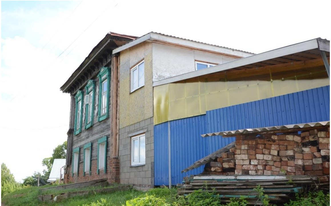
Фото 5. ОКН «Дом Лебедева». Вид на объект с северо-запада.

Без согласования Минкультуры Республики Марий Эл уничтожены западные двухэтажные деревянные сени с обшивкой тесом, имеющие на 2-м этаже два окна с деревянными наличниками и входную дверь главного входа; на их месте выполнено строительство западного двухэтажного пристроя.