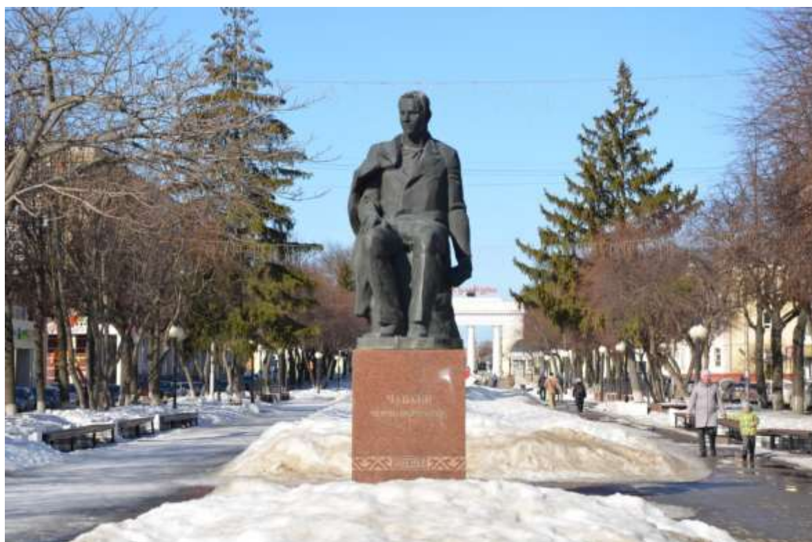
Фото 2. ОКН «Памятник С.Г. Чавайну, 1982 г.». Общий вид объекта с юго-востока.