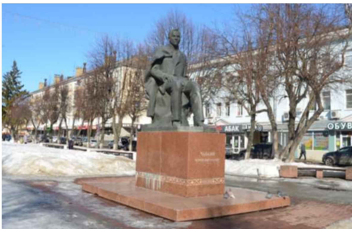
Фото 4. ОКН «Памятник С.Г. Чавайну, 1982 г.» Общий вид Объекта с юга.