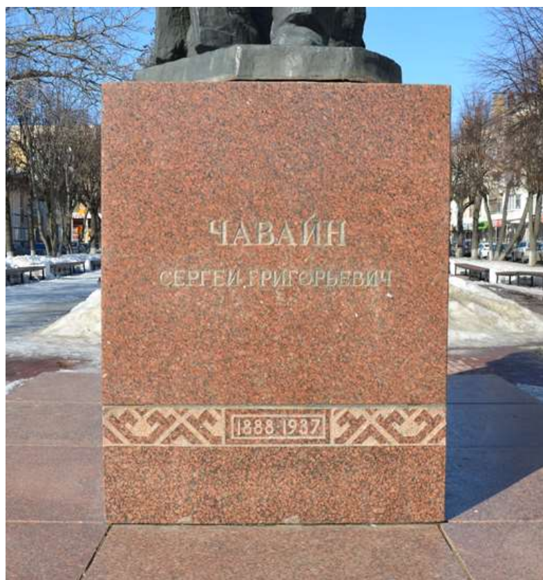
Фото 3. ОКН «Памятник С.Г. Чавайну, 1982 г.». Фрагмент Объекта, главный фасад постамента, вид с юго-востока.