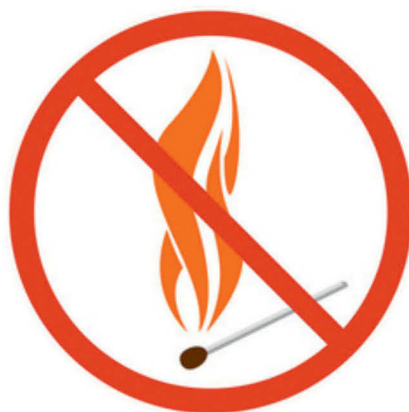
ВЫЖИГАНИЕ СУХОЙ ТРАВЯНИСТОЙ РАСТИТЕЛЬНОСТИ