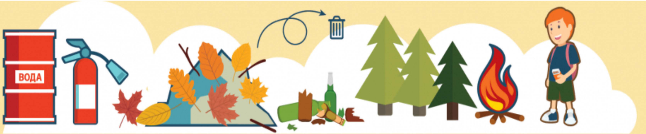
Рядом с емкостью нужно иметь металлический лист