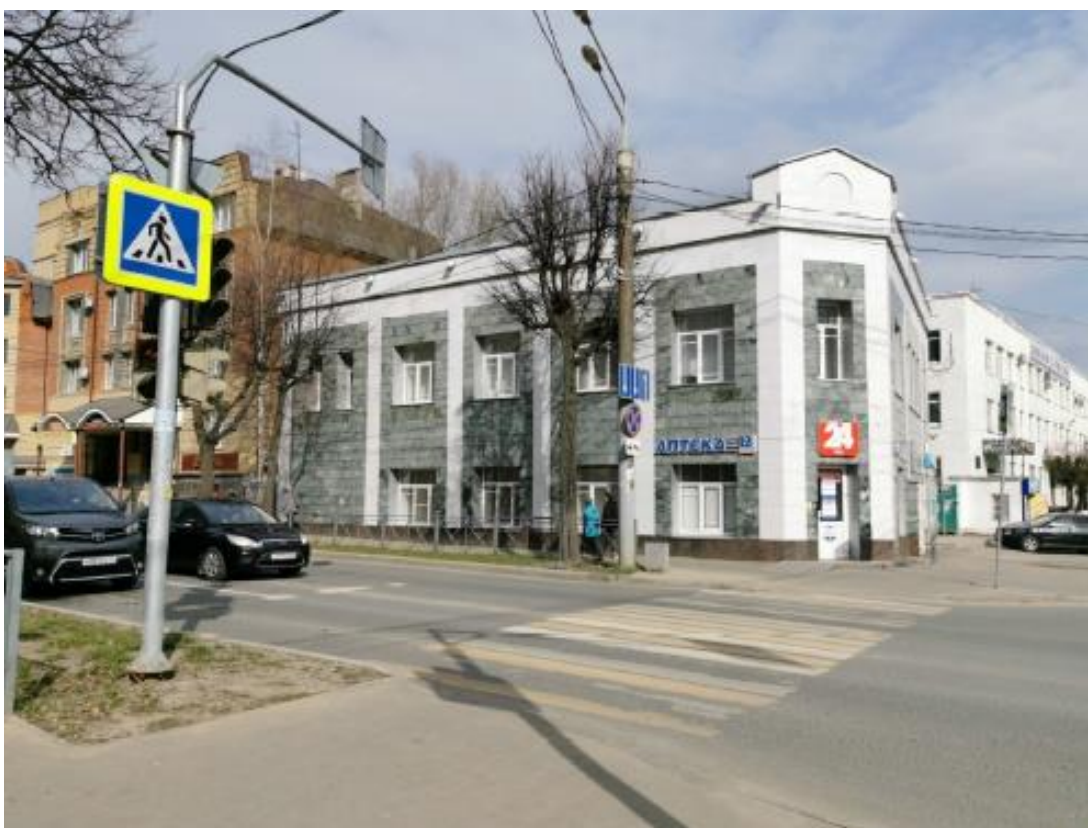
Вид на объект культурного наследия «Жилой дом».