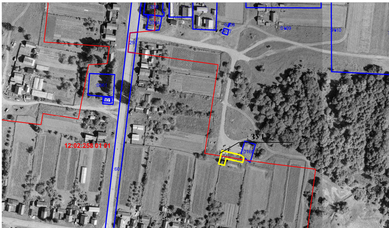
Масштаб 1: 1:3000

Местоположение ЗУ: примерно в 200 метрах по направлению на юг от ориентира: Республика Марий Эл, Горномарийский район, д. Яштуга, ул. Яштугинская, д.60;