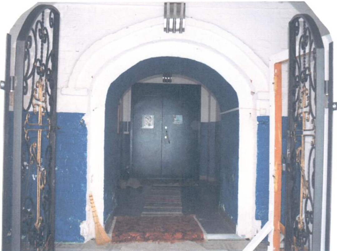
Фото 6. ОКН «Церковь Сретения Господня, 1801 г.». Фрагмент западного фасада. Покрытие пола - керамогранитная плитка, состояние удовлетворительное, входные двери металлические в удовлетворительном состоянии.