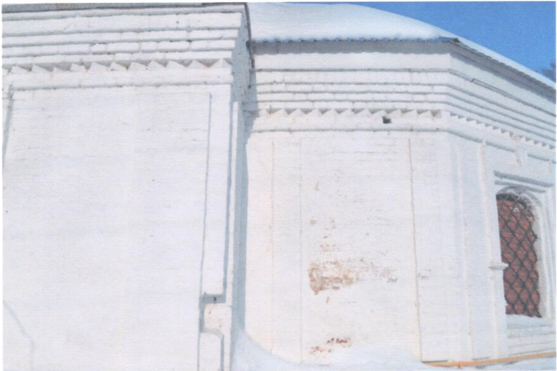
Фото 4. ОКН «Церковь Сретения Господня, 1801 г.». Фрагмент южного фасада. Стены из керамического кирпича в удовлетворительном состоянии, отслоение обмазочного слоя, система наружного водостока отсутствует, архитектурный декор фасадов имеет сколы, на локальных участках незначительное отслоение обмазочного слоя, заполнения оконных проемов алтаря отсутствуют, сохранились кованые металлические решетки на окнах.