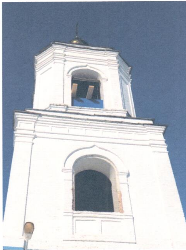
Фото 3. ОКН «Церковь Сретения Господня, 1801 г.». Фрагмент южного фасада. Стены из керамического кирпича в удовлетворительном состоянии, отслоение обмазочного слоя, архитектурный декор фасадов имеет сколы, на локальных участках незначительное отслоение обмазочного слоя.