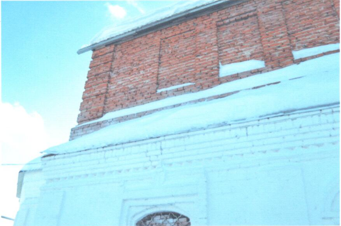
Фото 5. ОКН «Церковь Сретения Господня, 1801 г.». Фрагмент северного фасада. В 1990-х годах выполнена частичная кладка стен 2-го яруса четверика, система наружного водостока отсутствует, наличие трещин на карнизе 1-го яруса четверика.