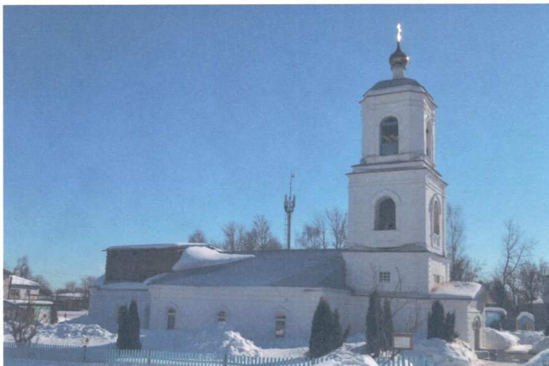
Фото 1. ОКН «Церковь Сретения Господня, 1801 г.». Общий вид объекта с северо-запада. Отмостка не обследовалась в связи с высоким уровнем снежного покрова, система наружного водостока отсутствует, в 1990-х годах выполнена частичная кладка стен четверика, поздние оконные блоки – пластиковые, остеклены, без сохранения исторической расстекловки.