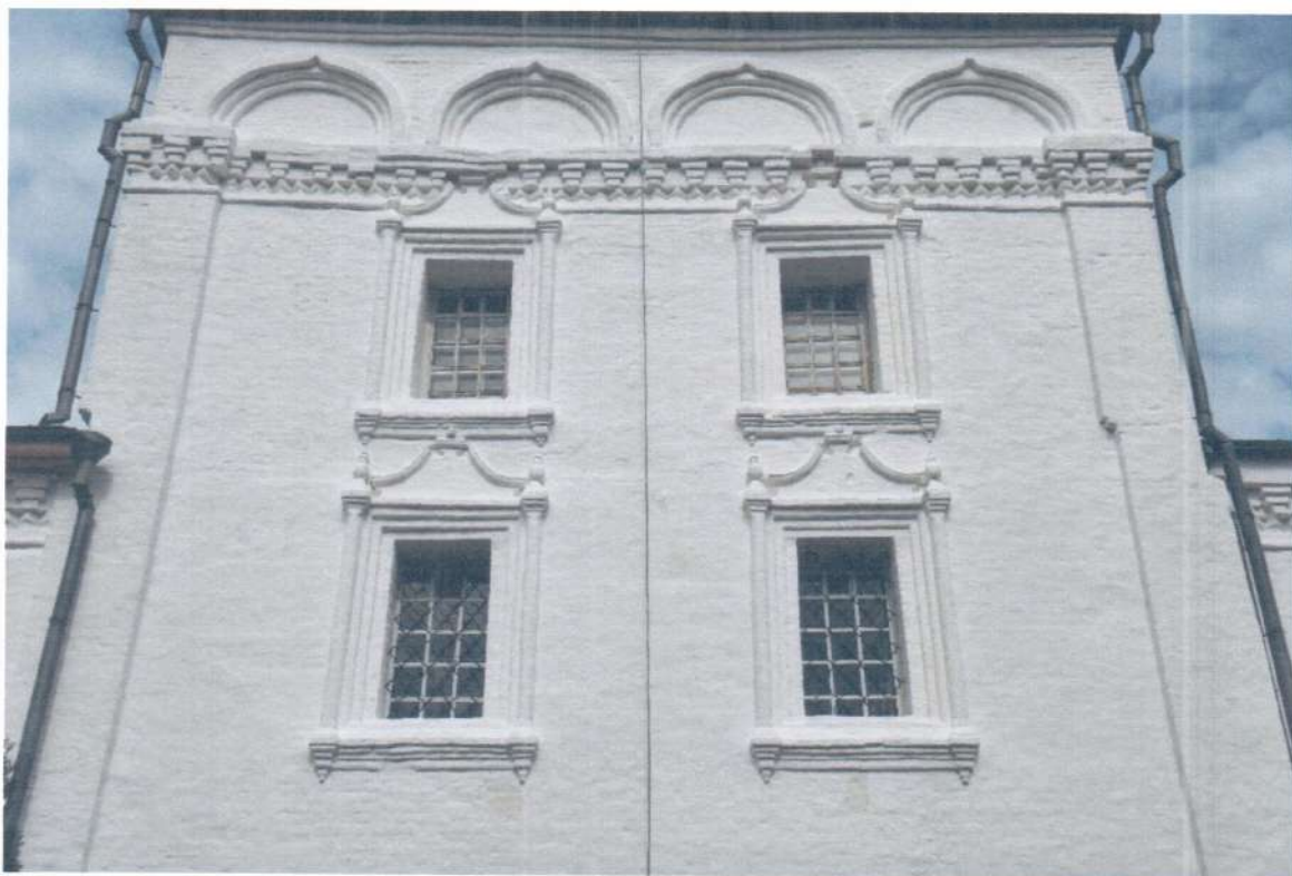
Фото 5. ОКН «Церковь Ежово-Мироносицкого монастыря». Фрагмент южного фасада.