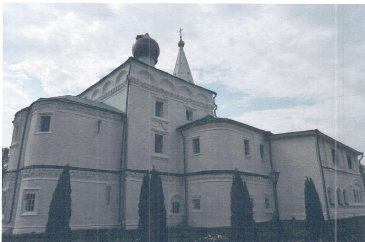
Фото 4. ОКН «Церковь Ежово-Мироносицкого монастыря». Общий вид объекта с северо-востока.