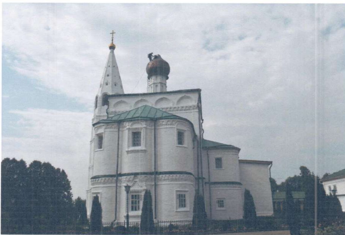
Фото 3. ОКН «Церковь Ежово-Мироносицкого монастыря». Общий вид объекта с востока.