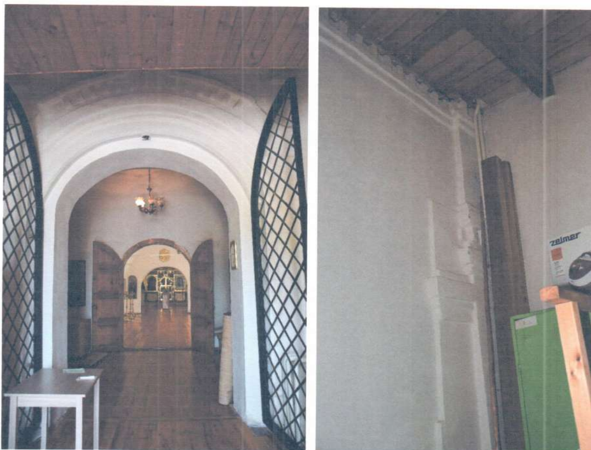
Фото 9. ОКН «Церковь Ежово-Мироносицкого монастыря». Фрагмент интерьера 1-го этажа (паперть).