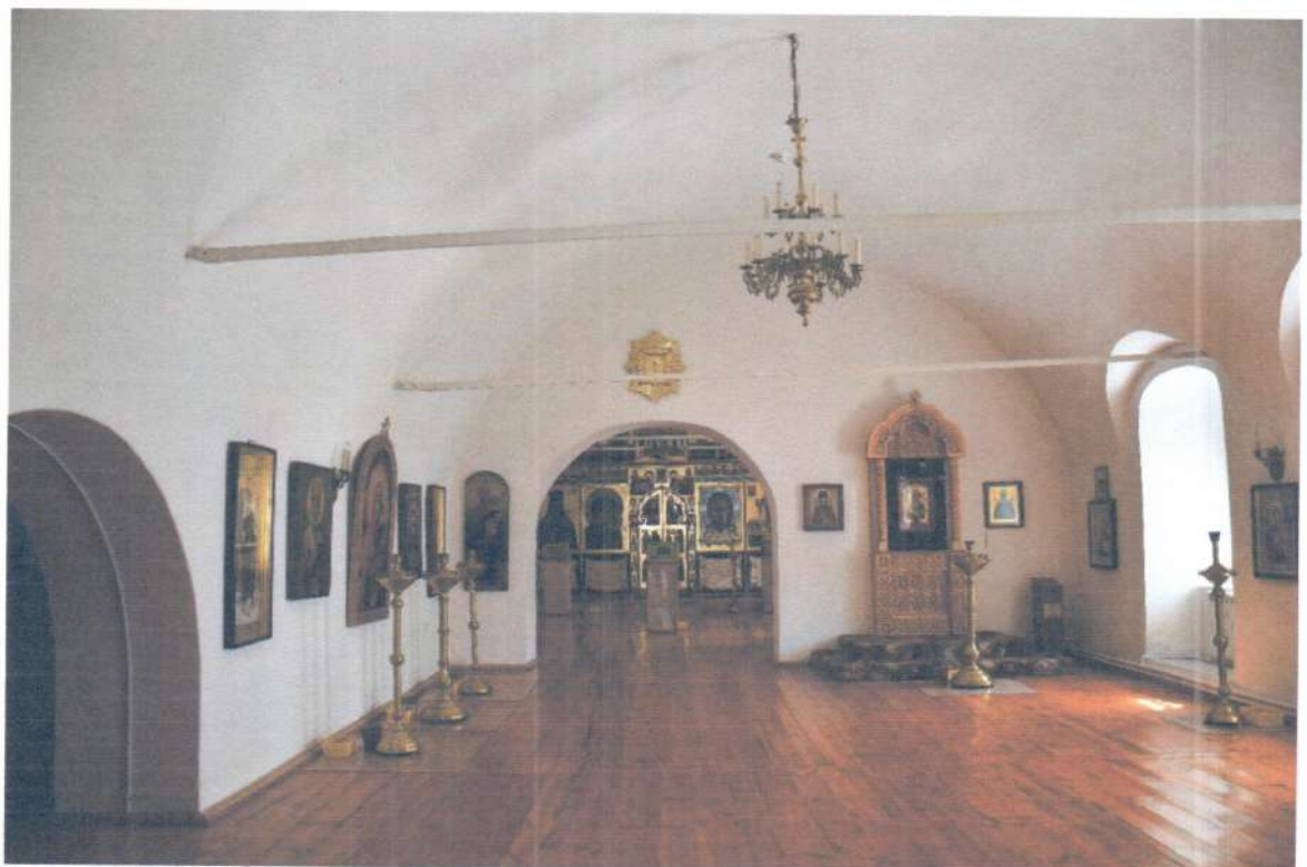
Фото 8. ОКН «Церковь Ежово-Мироносицкого монастыря». Фрагмент интерьера 1-го этажа.