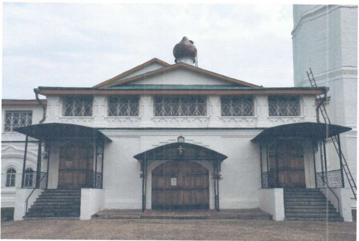
Фото 7. ОКН «Церковь Ежово-Мироносицкого монастыря». Фрагмент западного фасада.