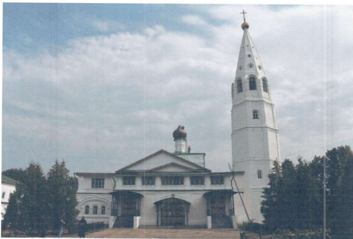
Фото 1. ОКН «Церковь Ежово-Мироносицкого монастыря». Общий вид объекта с запада.