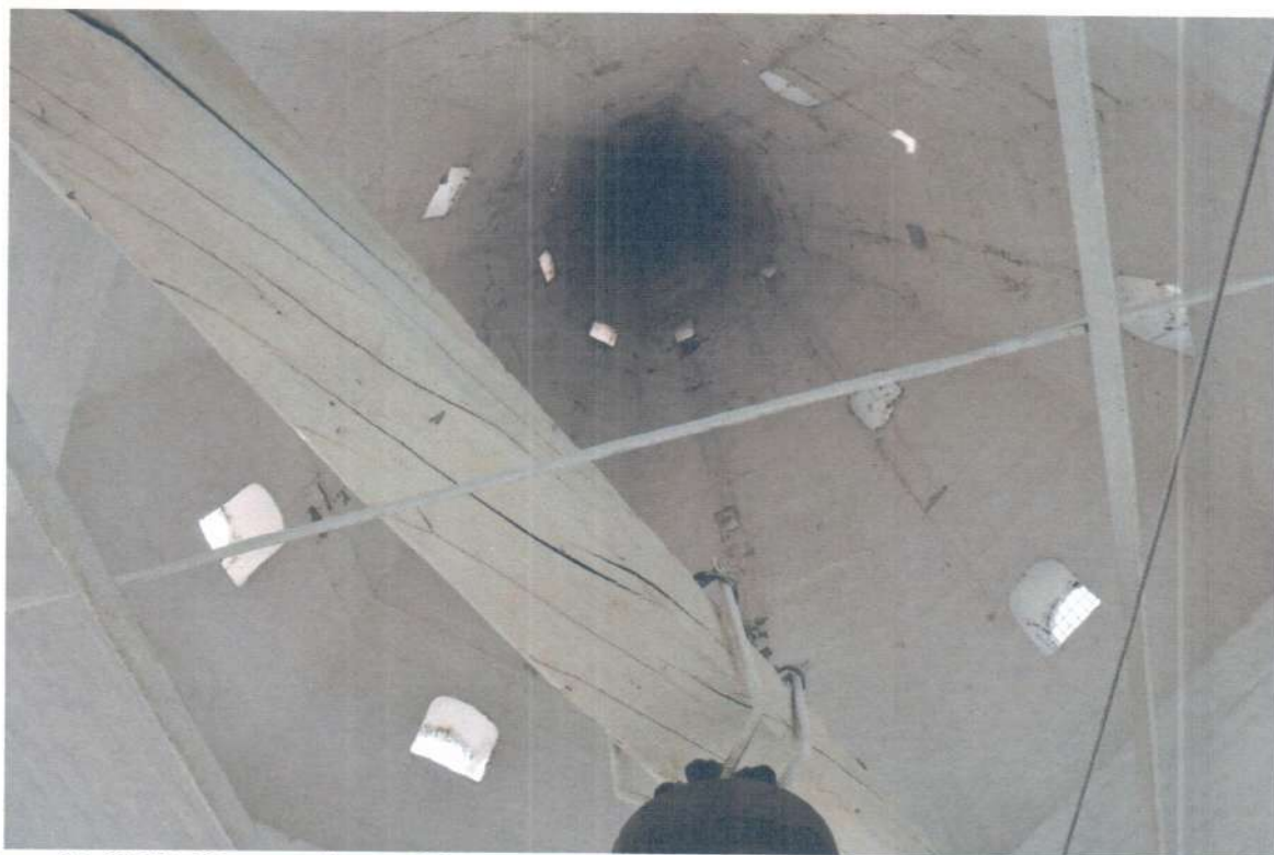
Фото 10. ОКН «Церковь Ежово-Мироносицкого монастыря». Фрагмент интерьера (колокольня).