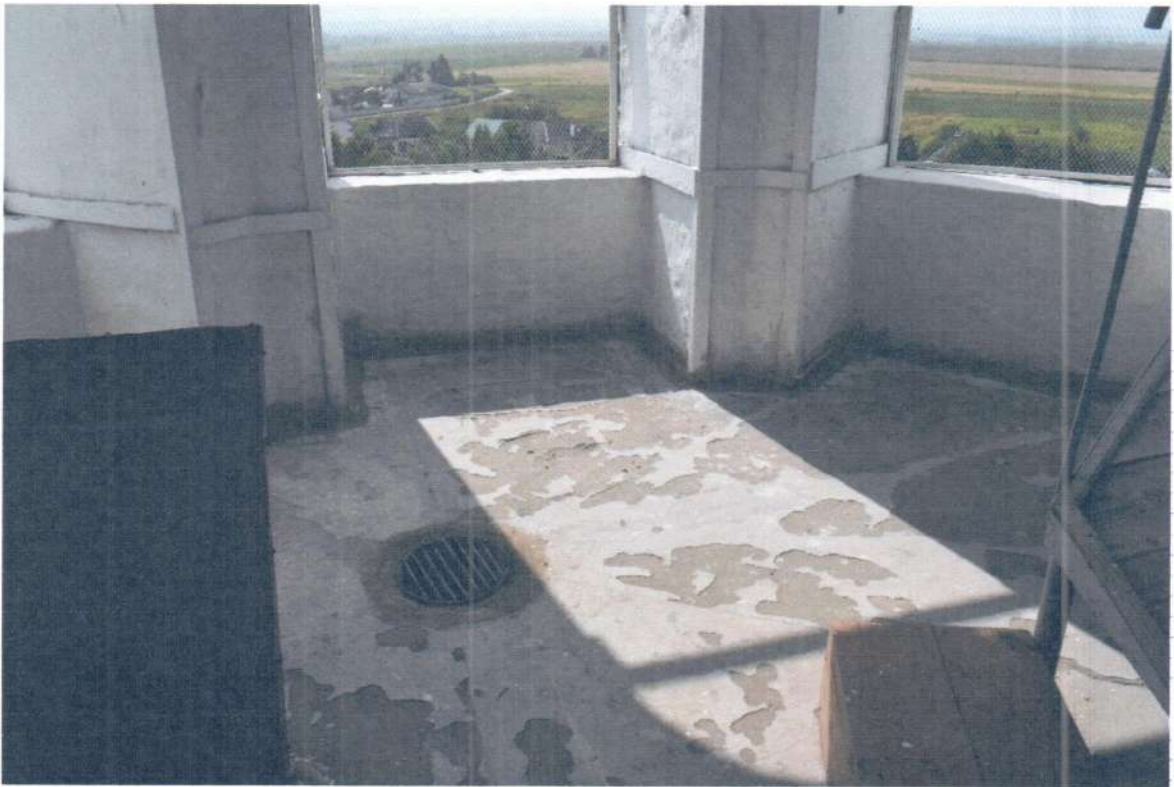
Фото 11. ОКН «Церковь Ежово-Мироносицкого монастыря». Фрагмент интерьера (колокольня).