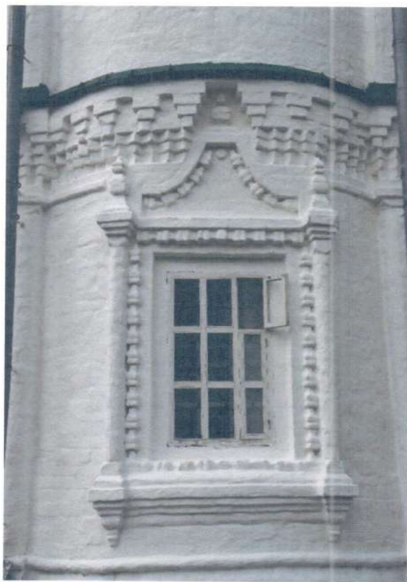
Фото 6. ОКН «Церковь Ежово-Мироносицкого монастыря». а) Фрагмент южного фасада; б) Фрагмент восточного фасада.