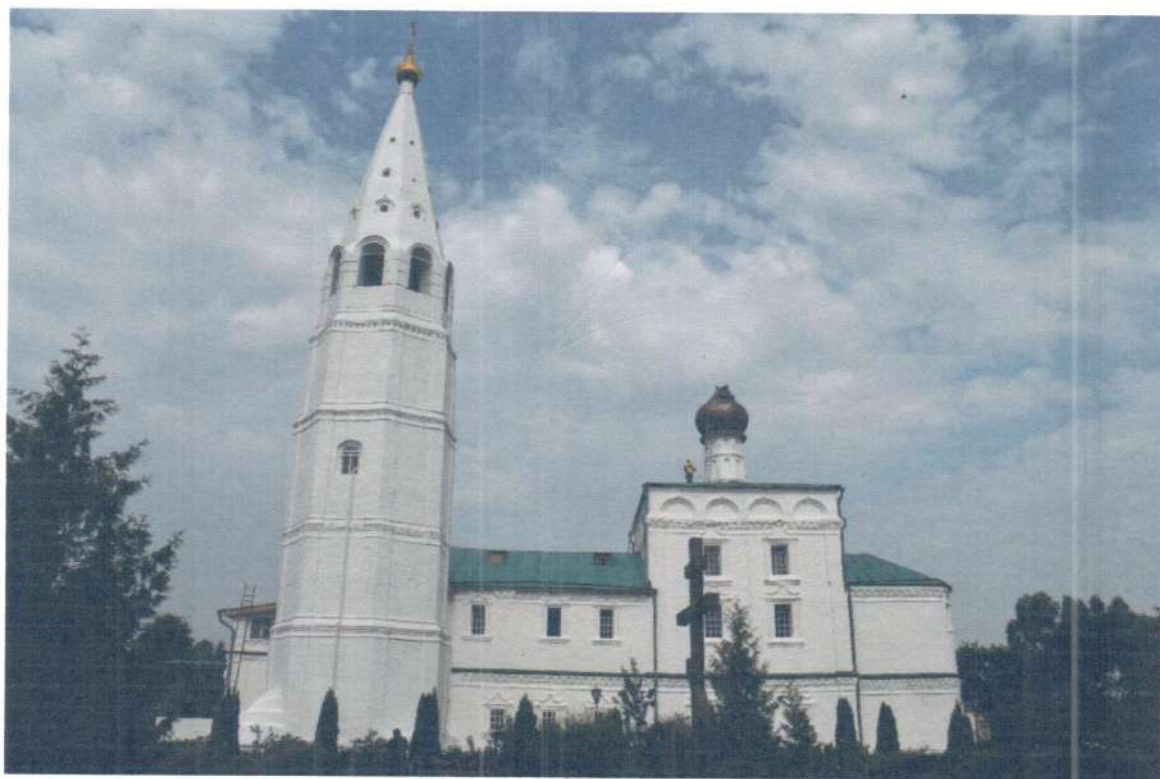
Фото 2 ОКН «Церковь Ежово-Мироносицкого монастыря». Общий вид объекта с юга.