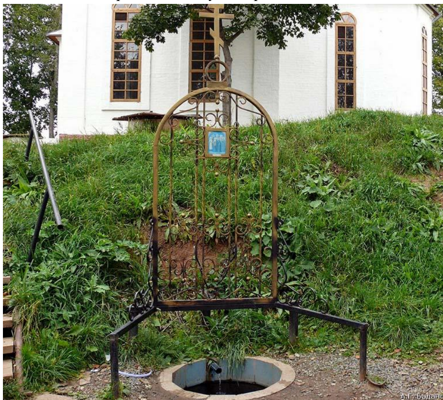
Мироносицкий чудотворный источник