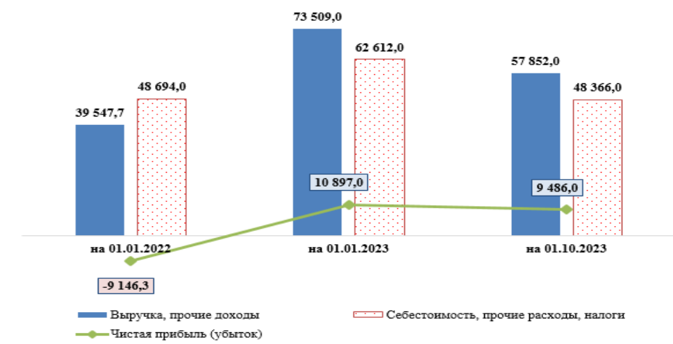
Диаграмма 3 тыс. рублей

Положительная динамика чистой прибыли сформировалась за счет