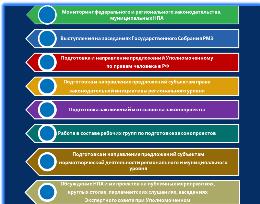
Рис. 1. Основные формы участия Уполномоченного в нормотворческой деятельности