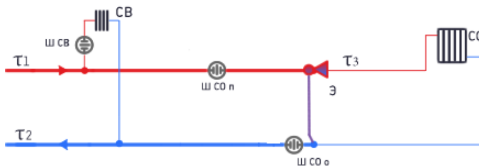
Рисунок 3 – Схема подключения потребителей к двухтрубной тепловой сети (при наличии внутридомовой системы отопления), в качестве регулятора температуры используется элеватор (СО – система отопления, Э – элеватор, СВ – система вентиляции)