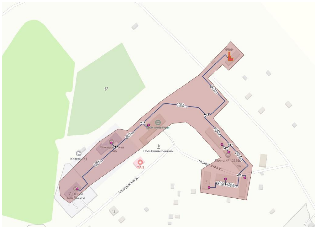
Рисунок 4 – Зоны действия Котельной д. Русская Лязмарь

Зона действия источников тепла представлена на рисунке ниже.