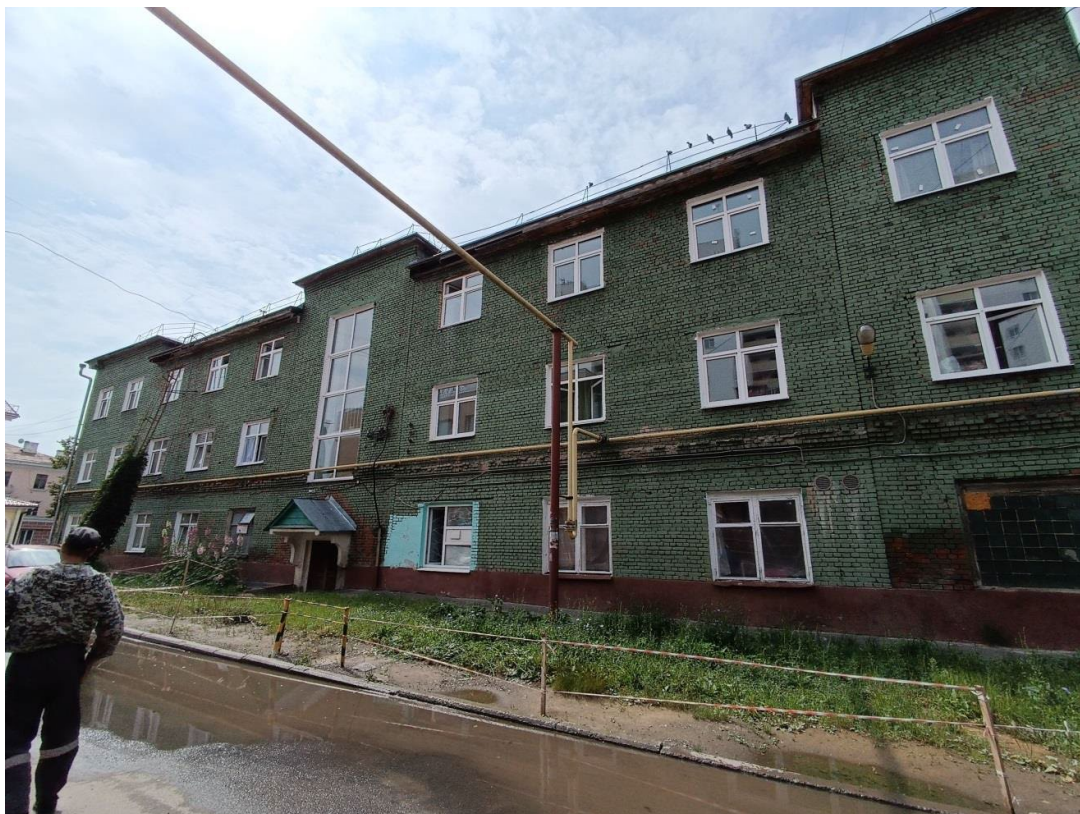
Фото 5. Дворовый фасад здания.