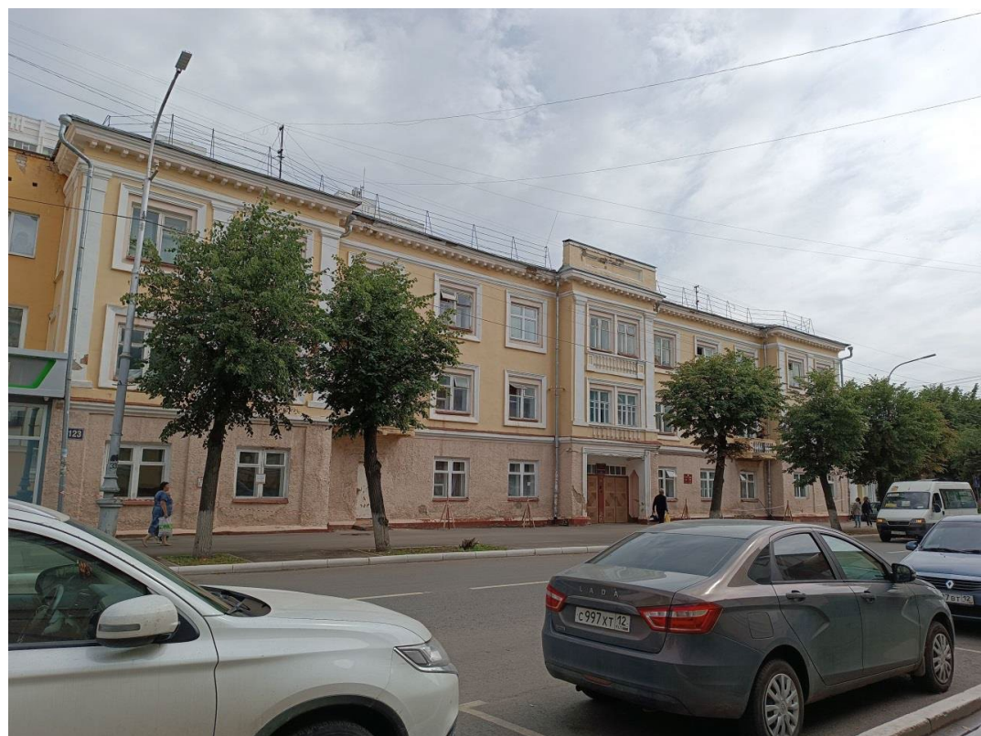
Фото 2. Главный (северо-западный) фасад по ул. Советская.