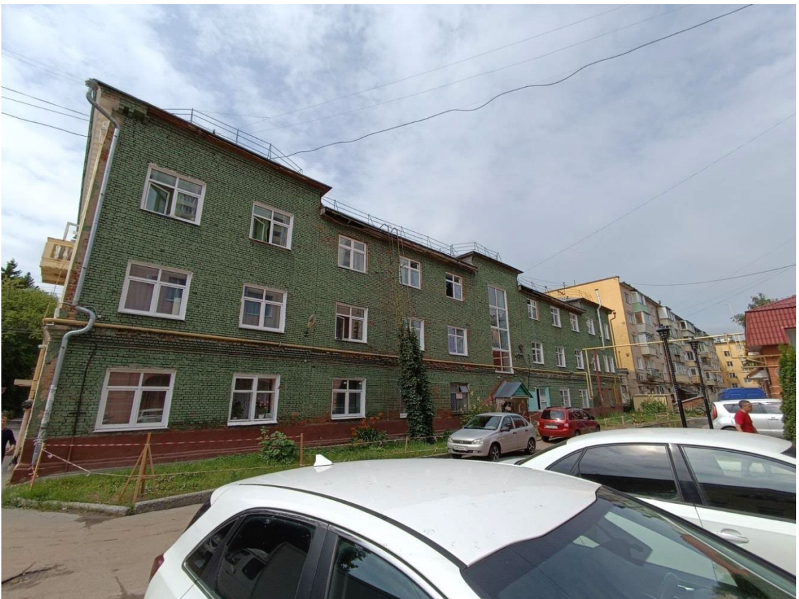
Фото 4. Дворовый фасад здания.