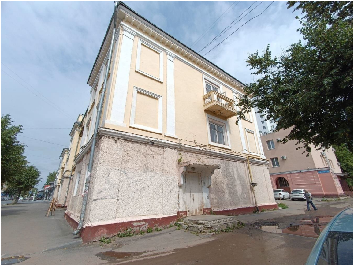
Фото 3. Боковой фасад здания. Вид с ул. Советской.