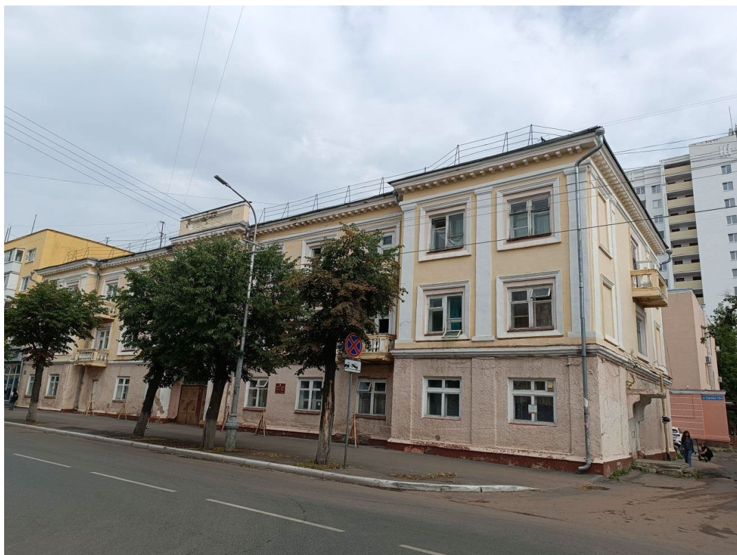
Фото 1. Главный (северо-западный) фасад по ул. Советская.

Фотофиксация Объекта выполнена на момент заключения договора на проведение настоящей историко-культурной экспертизы