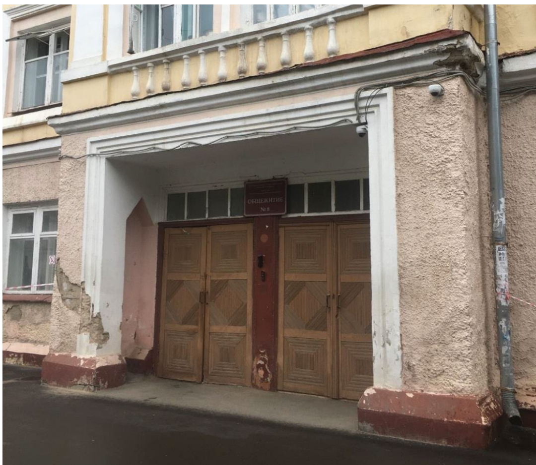
Фото 6. Центральный ризалит. Портал входа.