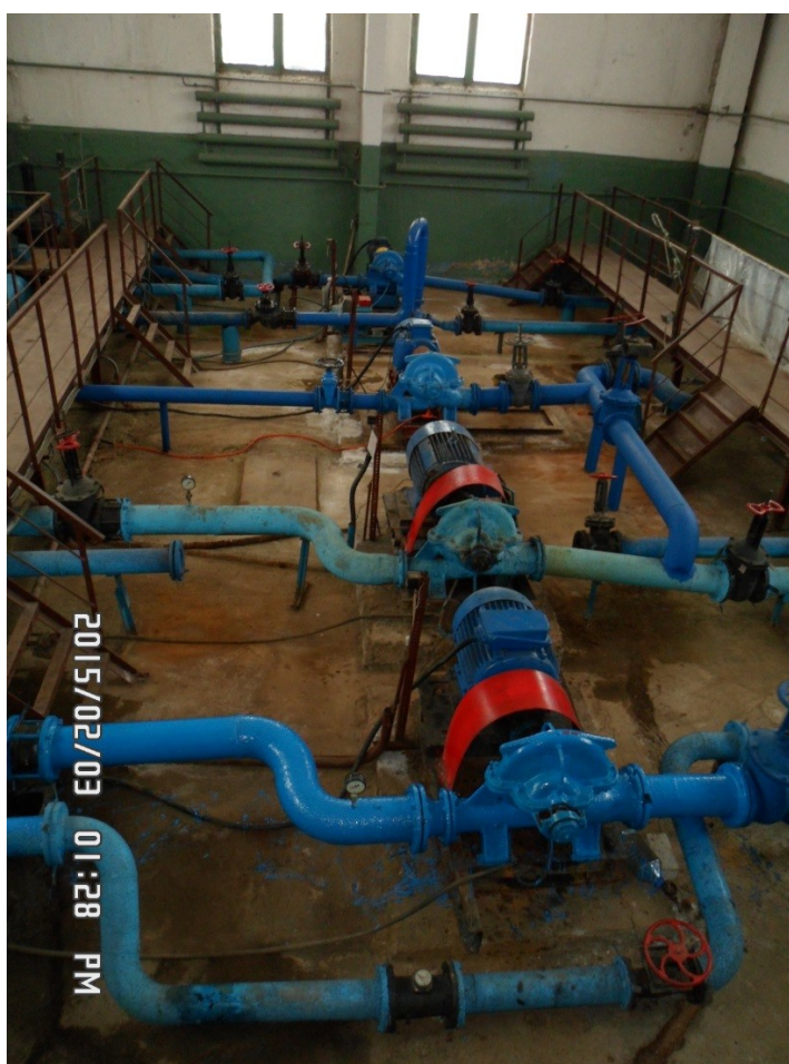
Рис. 1.4.2. Внешний вид машинного зала здания водозабора кирпичного завода