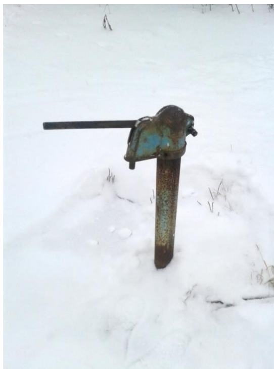
Рис. 1.2.1. Фотография водоразборной колонки, используемой в частном секторе