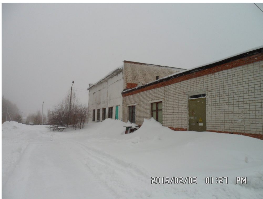
Рис. 1.4.1. Внешний вид здания водозабора кирпичного завода