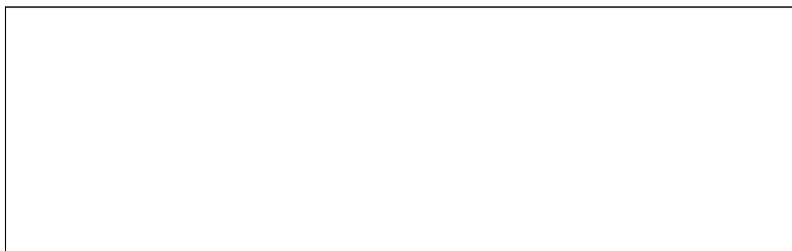
Рис 9.1.3. Фрагмент карты поселения с обозначенными на нем объектами централизованной системы водоотведения

Фрагмент карты поселения с обозначенными на нем объектами централизованной системы водоотведения представлен на рис. 9.1.3.