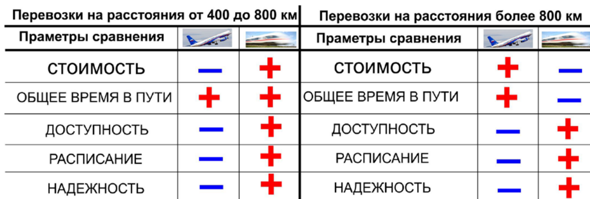
Таблица 2.1. Сравнение привлекательности перевозок для пассажиров авиационным и высокоскоростным железнодорожным транспортом в зависимости от расстояния.

Практика показывает, что высокоскоростной железнодорожный транспорт экономически эффективен и привлекателен для пассажиров по соотношению «цена/скорость» при перемещениях на расстояния от, примерно, 400 км до 1200 км (в среднем -около 800 км) при скоростях от 200 до 400 км/час, соответственно (Табл. 2.1). Себестоимость перевоз железнодорожным транспортом оказывается ниже, а объем перевозок выше, чем альтернативными видами транспорта.