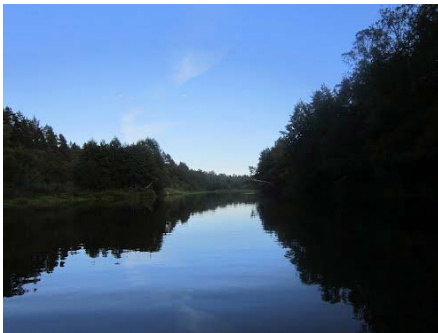
Рисунок 6.2. Река Илеть в районе перехода трассы ВСМ-2