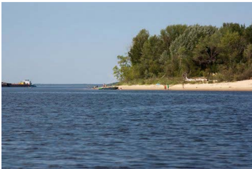
Рисунок 6.1. Река Волга в районе перехода трассы ВСМ-2 на границе Республики Марий Эл и Республики Чувашия

http://www.panoramio.com/photo/45428753?source=wapi&referrer=kh.google.com