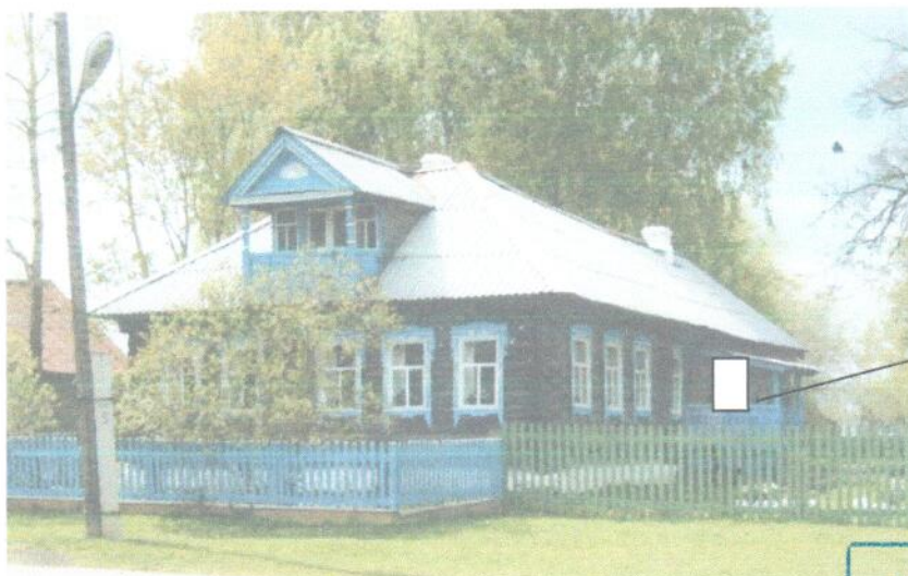
Фото фрагмента фасада с привязкой к месту установки информационной доски