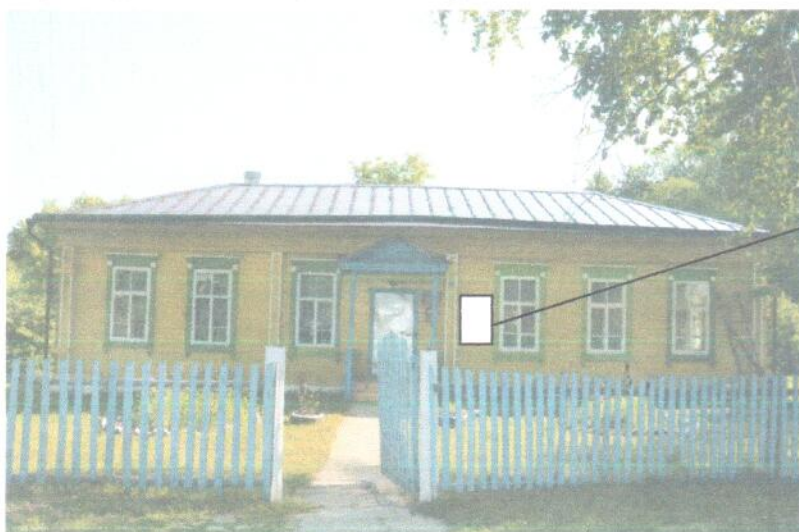
Фото фрагмента фасада с привязкой к месту установки информационной оски

СОГЛАСОВАНО Министерство культуры, печати и по делам национальностей Республики Марий Эл 20.08.2021 г. Распоряжение № 14/1-2021-14 Иванова И.И.