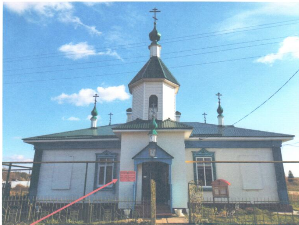
фото фасада с привязкой к месту установления информационной надписи