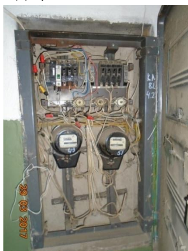
До установки системы